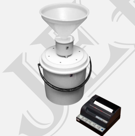
Aparat gotowy do pracy

Wydruk wartości wskaźnika uroflowmetrycznego wg nom. Siroky, interpretacja