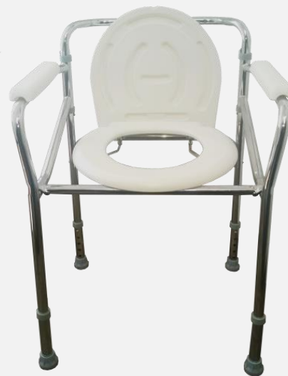
Krzesełko mikcyjne typ W-KM